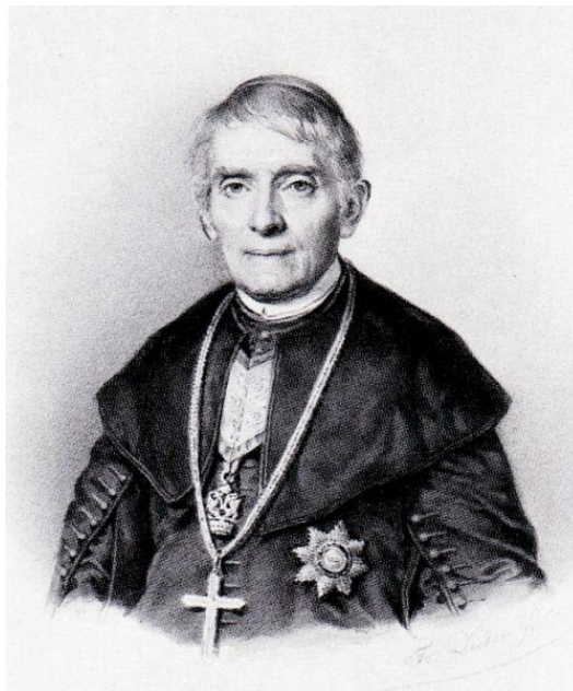
Pyrker János érsek

Amikor kihúzatta Pyrker János egri érsek hintója kerekének csapszegét , az ország harmadik legnagyobb templomának építtetője egy sötét erdő közepén gurult az avarba.