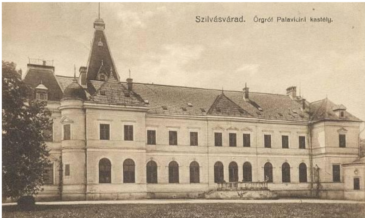
A kastély átépítése előtt

A kastélyt a Pallaviciniek építették át neobarokk stílusban és 1944-ig a család tulajdonában maradt.