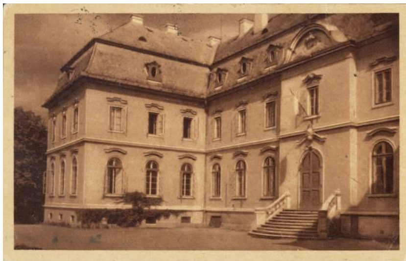
Neobarokk stílusban átépített kastély

A II. világháborút követően a kastélyt államosították, s hosszú évekig SZOT üdülőként működött. Utolsó komolyabb renoválása 1981-ben, a Szilvásváradon megrendezett fogathajtó világbajnokság alkalmából volt. A rendszerváltást követően több más SZOT üdülőhöz hasonlóan a HUNGUEST HOTELS szállodalánchoz került, s ebben a kötelékben működött kétcsillagos szállóként egészen 2005-ig.